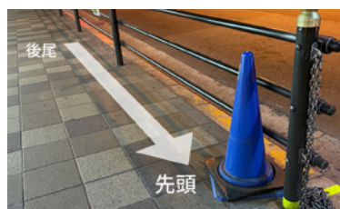
ブルーのカラーコーンを先頭にお並び ください。 Kindly queue behind the blue traffic cone.