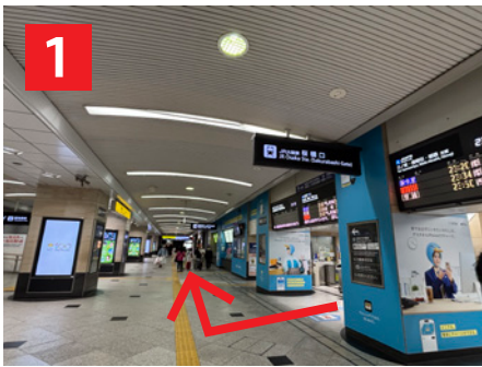
1 JR大阪駅「桜橋口」を出て右へ Exit JR Osaka Station 'Sakurabashi Exit' and turn right.