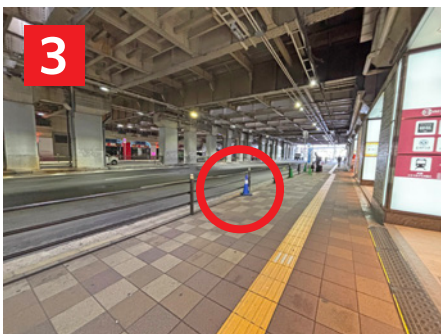
シャトルバス乗り場 Bus Stop