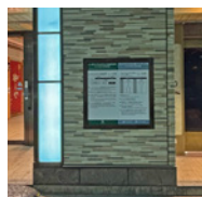
ブルーのカラーコーン位置が乗車位置となります。 時刻表は、右手に案内板よりご確認ください。 The boarding position is marked by the blue traffic cone. The timetable can be found on the information board on the right hand side.